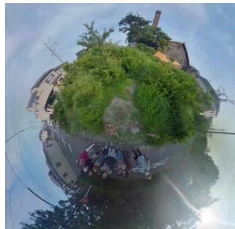
高浜市の古い町並み。瓦工場の跡地にて